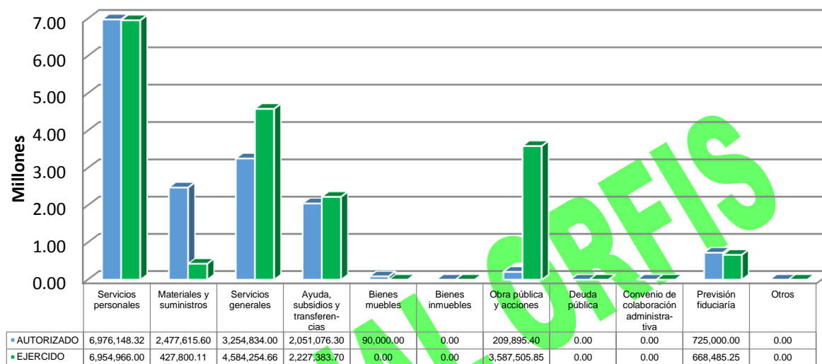
GRÁFICA 2 EGRESOS